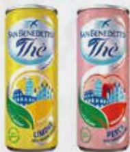
THE LIMONE/PESCA SAN BENED. LATT. CL 33 SLEEK art.01821