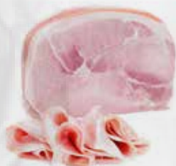
PROSCIUTTO COTTO SILVER AL KG S/POLI. art.S158