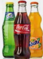
COCA COLA/FANTA SPRITE CL 33 VAP - art.11292