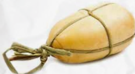
PROVOLA BIANCA/AFFUMICATA S/V DIANO AL KG art.F036/7