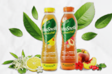
VITASNELLA DEPURATHE PESCA/LIMONE CL 50 - art.13137