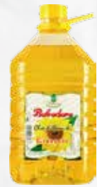
OLIO SEMI GIRASOLE PET LT 5 BELVEDERE KG 1,730 art.10563