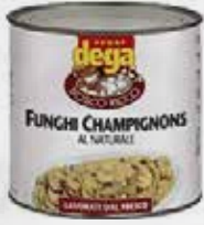
FUNGHI AL NATURALE FETTE TIPO KG 3 CIRC art.H124