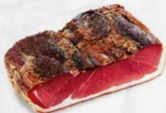
SPECK I CLASSICI 1/2 S.V. SEGATA AL KG art.10593