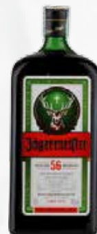
JAGERMEISTER LT 1 art.10291