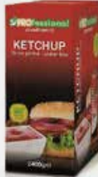
KETCHUP MONODOSE 12g x 200 bst GF art.11976