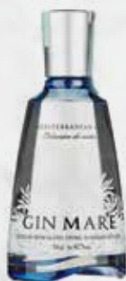
GIN MARE MEDITERRANEAN CL 70 - art.11848