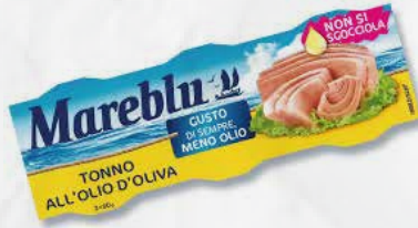
TONNO MAREBLU OLIO OLIVA GR 80 x 3 art.09034