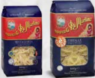
PASTA DI GRAGNANO Gr 500 VARI FORMATI art.11346