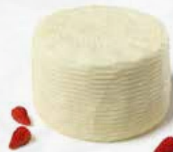
PECORINO PRIMO SALE BIANCO AL KGKG 1,730 art.F123