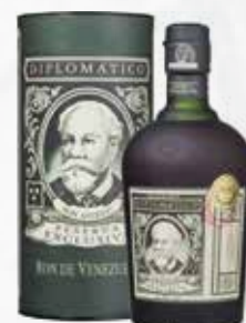
RUM DIPLOMATICO RESERVA EXCLUS. CL70 AST art.06626