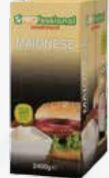
MAIONESE MONODOSE 12g x 200 bst GF art.11975