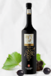
GRAPPA PRIME UVE NERE CL 70 art.02941