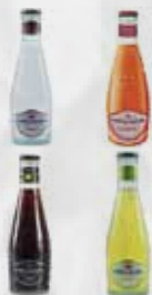
BIBITE SANPELLEGRINO CL 20 VARI TIPI